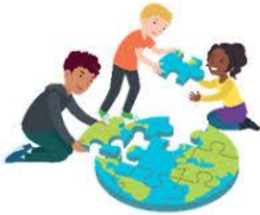
We dragen allemaal een steentje bij

Deze week is blok 5 van Vreedzaam gestart. Het gaat in dit blok over 'een steentje bijdragen'. Binnen alle groepen wordt afgesproken waarover de kinderen mee mogen denken en beslissen. Als de kinderen zich betrokken voelen bij hun groep en het kindcentrum, ontstaat een positieve sfeer. Ze zijn dan gemotiveerd om deel te nemen aan wat in de groep gebeurt. Een van de verantwoordelijkheden van een aantal kinderen is het werken als leerlingmediator. Zij dragen een steentje bij aan het oplossen van een conflict als dat nodig is. En we hebben ook een leerlingenraad. Deze raad denkt en beslist mee over nieuwe ideeën van de Vindplaats. Een steentje